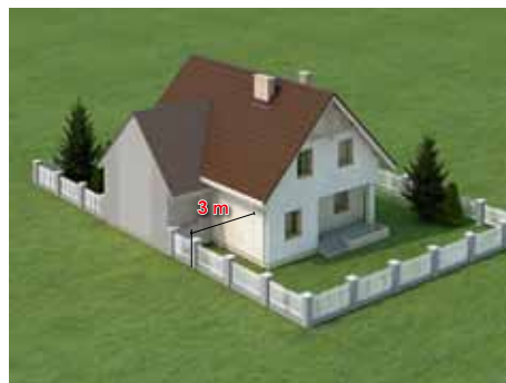
Budynek stojący przy granicy można rozbudować, jeśli w pasie 3 m wzdłuż granicy zachowa się dotychczasowe wymiary. *