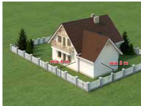
Budynek można usytuować 3 m od granicy – gdy ściana jest bez otworów, lub 4 m od granicy – gdy w ścianie są okna lub drzwi. *

Uwaga: Podane w katalogu usytuowanie budynku na działce jest przykładowe. Realne odległości budynku od granic działki mogą być różne i zależą od warunków miejscowych, bądź zmieniających się przepisów. Wybór projektu domu i usytuowanie go na działce należy konsultować z architektem adaptującym projekt.