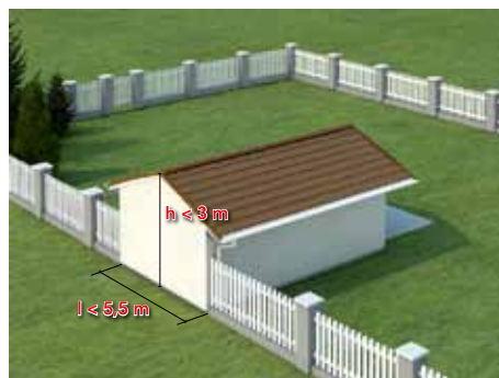
Niewielki garaż może stać przy granicy z sąsiednią działką budowlaną lub w odległości nie mniejszej niż 1,5 m. *