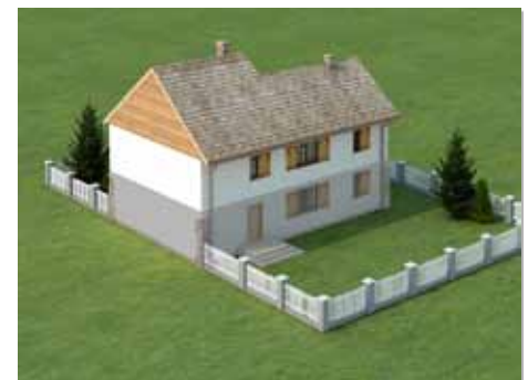
Budynek stojący przy granicy można nadbudować o jedną kondygnację. *