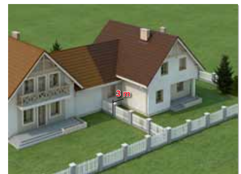
Nowy dom może przylegać całą powierzchnią ściany do budynku istniejącego na sąsiedniej działce i w pasie 3 m wzdłuż granicy. Nie może być od niego większy. *