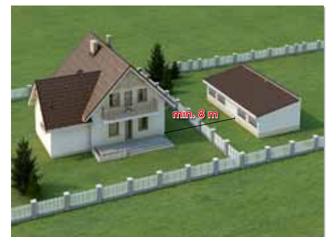
Budynek inwentarski lub gospodarczy z oknami w stronę granicy nie może stać bliżej niż 8 m od budynku mieszkalnego na sąsiedniej działce. *

* UWAGA! Podane odległości mogą się zwiększyć z uwagi na przepisy o zacienieniu i przepisy przeciwpożarowe.