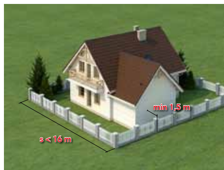
Gdy działka jest węższa niż 16 m, można wybudować dom w ostrej granicy lub nie bliżej niż 1,5 m od granicy z sąsiadem. *